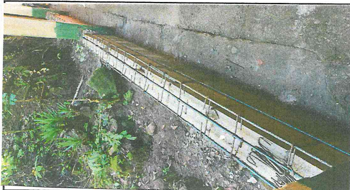
Foto 3: Durante la sustitución de malla por muro de block e hierro.