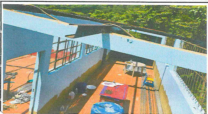
Foto 1: Corredor de la Antigua escuela durante la realización del cambio de lámina.